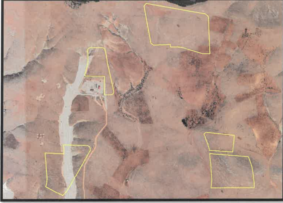
Şekil 1: Şehitkâmil İlçesi Küllü Mahallesi Planlama Alanı Konumu

Planlama alanı, Oğuzeli İlçesi, Çaybaşı Mahallesi ve Şehitkamil İlçesi, Küllü ve Taşlıca Mahalleleri sınırları içerisinde yer almaktadır.