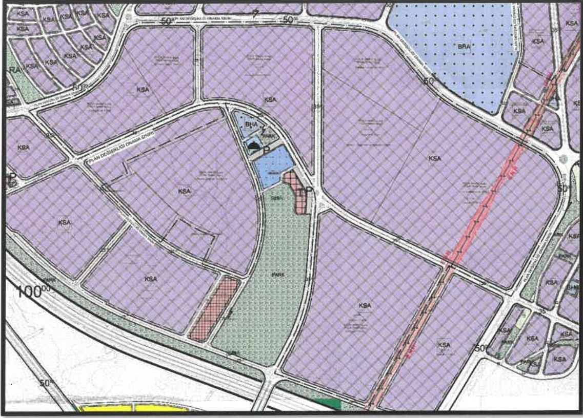
Şekil 10: Şehitkamil İlçesi Taşlıca Mahallesi Planlama Alanı Planlama Alanı Öneri 1/1000 Uygulama İmar Planı