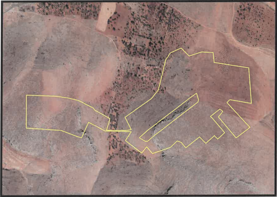
Şekil 4: Oğuzeli İlçesi Çaybaşı Mahallesi Planlama Alanı Konumu