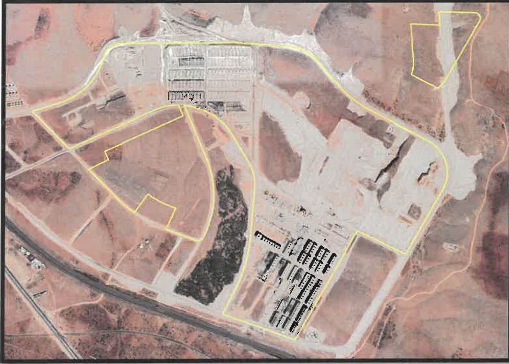
Şekil 2: Şehitkâmil İlçesi Taşlıca Mahallesi Planlama Alanı Konumu