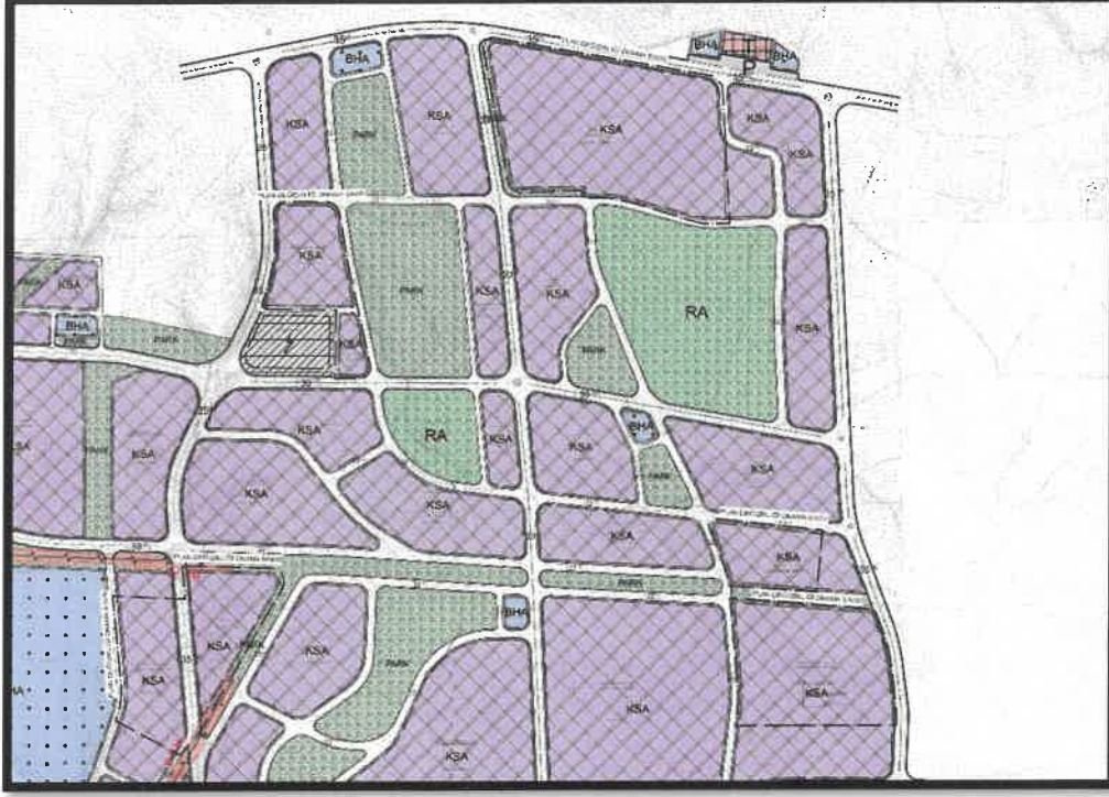
Şekil 5: Şehitkâmil İlçesi Küllü Mahallesi Planlama Alanı Mevcut 1/1000 Uygulama İmar Planı

Planlama alanları onaylı 1/1000 ölçekli Uygulama İmar planında Küçük Sanayi Alanı olarak görülmektedir.