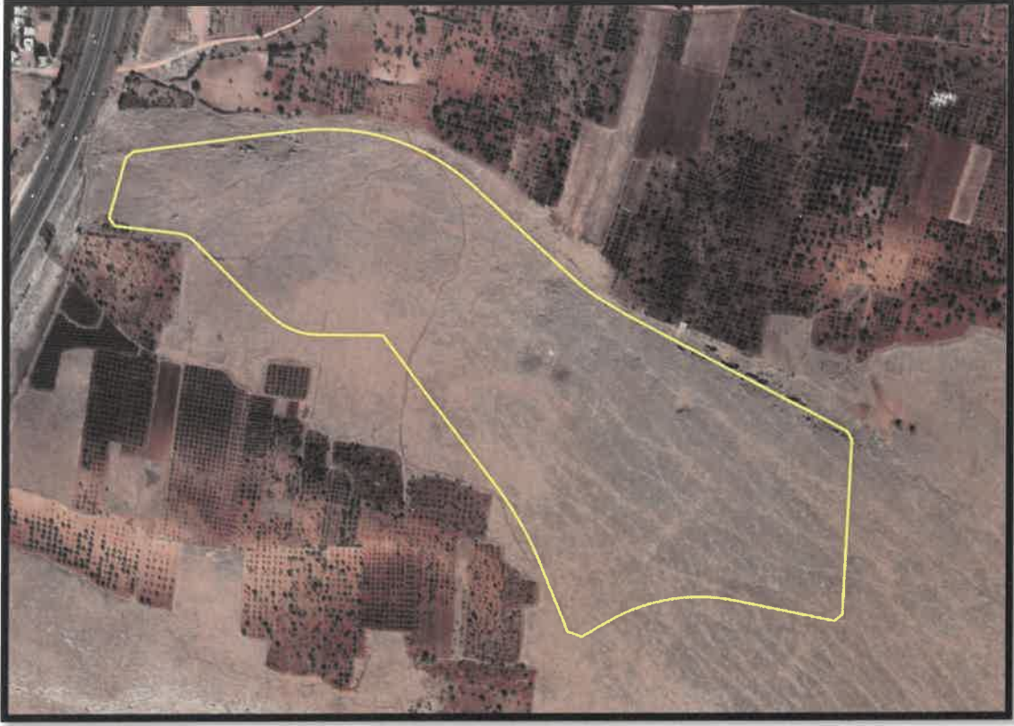
Şekil 3: Şehitkâmil İlçesi Taşlıca Mahallesi Planlama Alanı Konumu