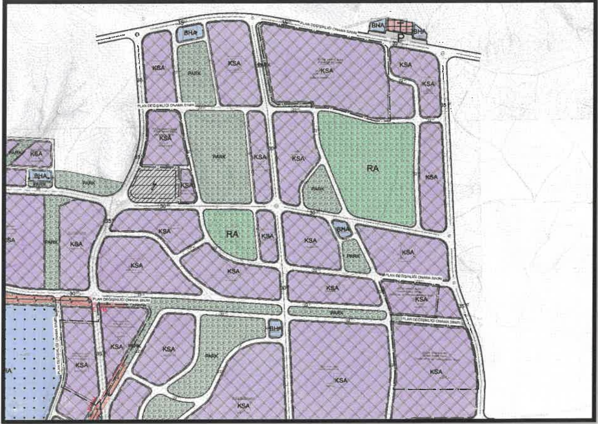
Şekil 9: Şehitkamil İlçesi Küllü Mahallesi Planlama Alanı Öneri 1/1000 Uygulama İmar Planı

Söz konusu planlama alanında mevcut uygulama imar planlarında Küçük Sanayi Alanı (Küçük Sanayi Sitesi) olarak görülen alanlarda yapılaşma ve uygulamada yaşanması muhtemel sorun ve karışıklıkların önüne geçmek amacıyla meslek sitelerinin isimlerinin yazılması ve meslek sitelerine yönelik plan notu eklenmesi şeklinde önerilen uygulama imar planı değişikliği hazırlanmıştır.