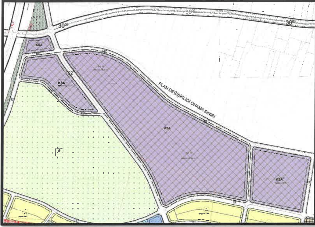
Şekil 7: Şehitkâmil İlçesi Taşlıca Mahallesi Planlama Alanı Mevcut 1/1000 Uygulama İmar Planı