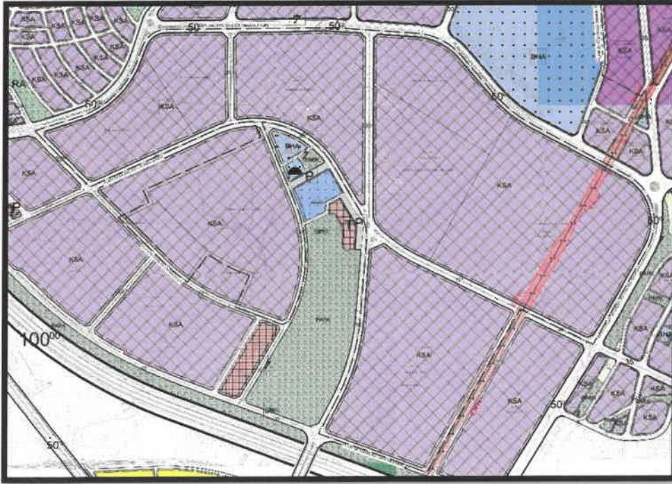
Şekil 6: Şehitkâmil İlçesi Taşlıca Mahallesi Planlama Alanı Mevcut 1/1000 Uygulama İmar Planı