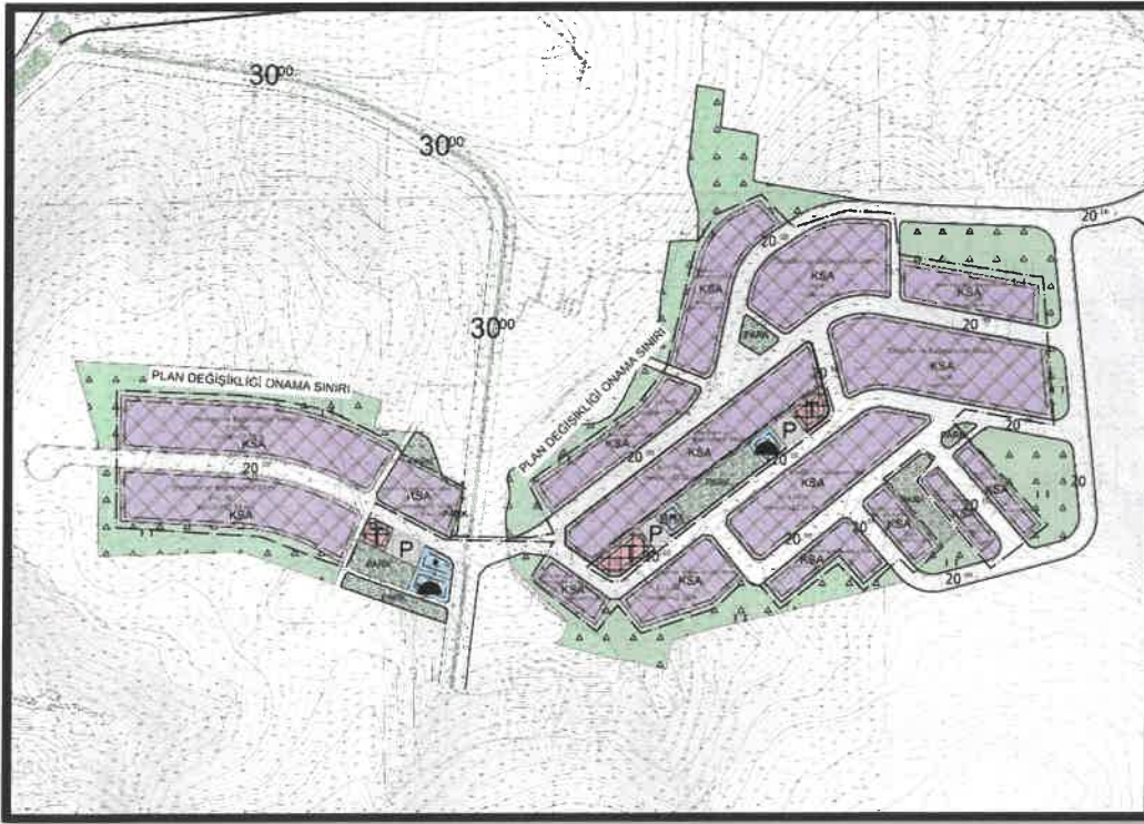
Şekil 8: Oğuzeli İlçesi Çaybaşı Mahallesi Planlama Alanı Mevcut 1/1000 Uygulama İmar Planı