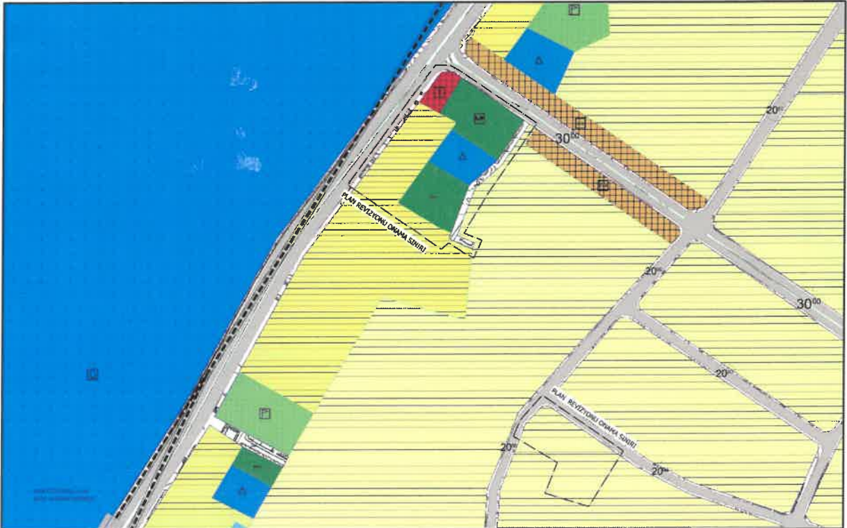
Şekil 3: 1/5.000 ölçekli mevcut nazım imar planı

1/5000 ölçekli mevcut nazım imar planında orta ve düşük yoğunluklu Konut, Ticaret, Rekreasyon, Eğitim, Yol ve Park Alanları olarak planlanmıştır.