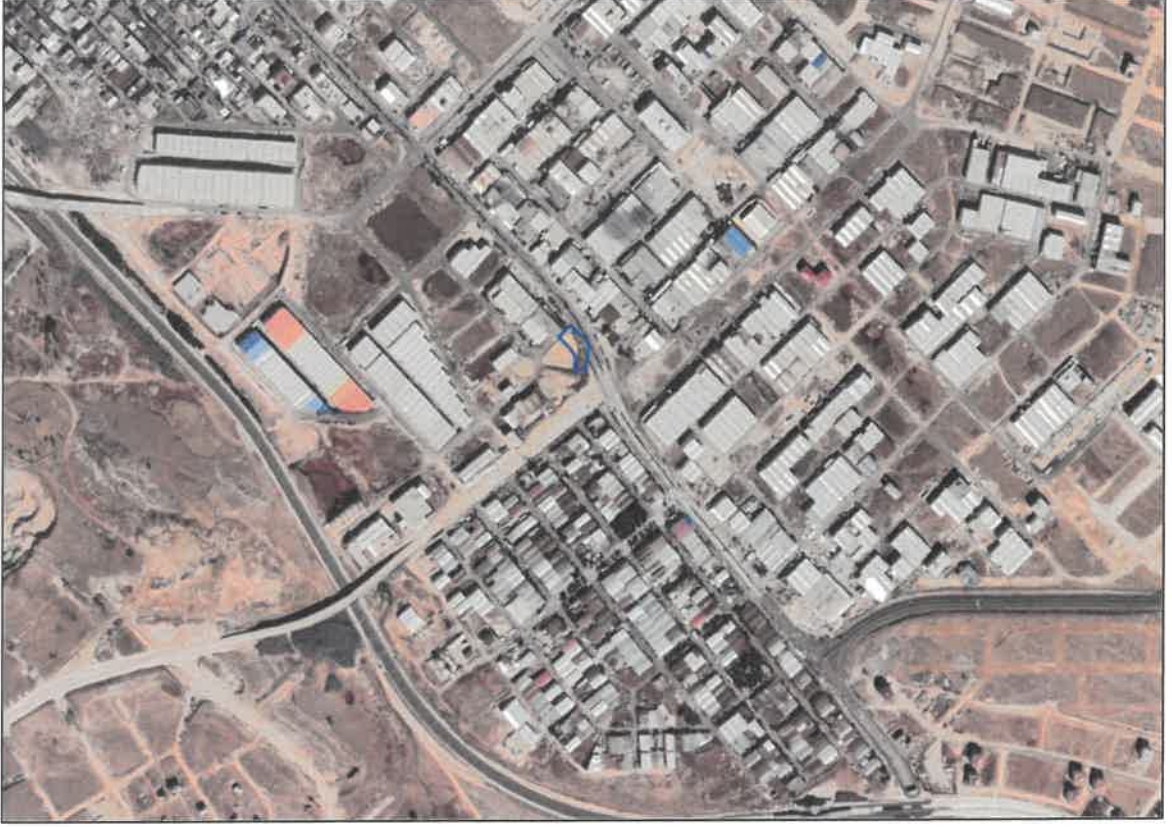
Şekil 1: Planlama Alanının Konumu

Plan deęişikliğine konu alan Taşlıca mahalleleri sınırları içerisinde anafartalar caddesinin güneyinde-güneybatısında yer almaktadır.