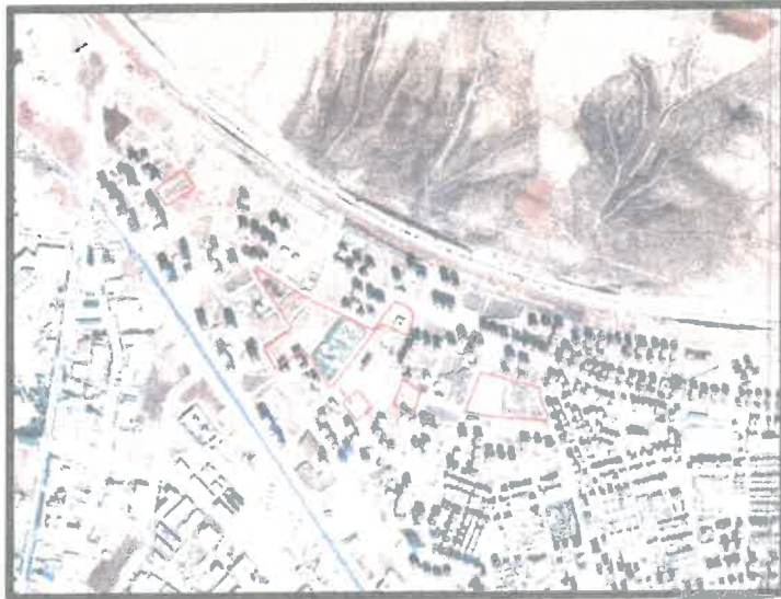
Planlama Alanının Konumu

İlave revizyon nazım imar planına konu olan, Belkıs Mahallesi N38-C3 ve N38c-14d paftalarında bulunan alanlar Tarsus-Adana-Gaziantep Otoyolu'nun güneyinde yer almaktadır.