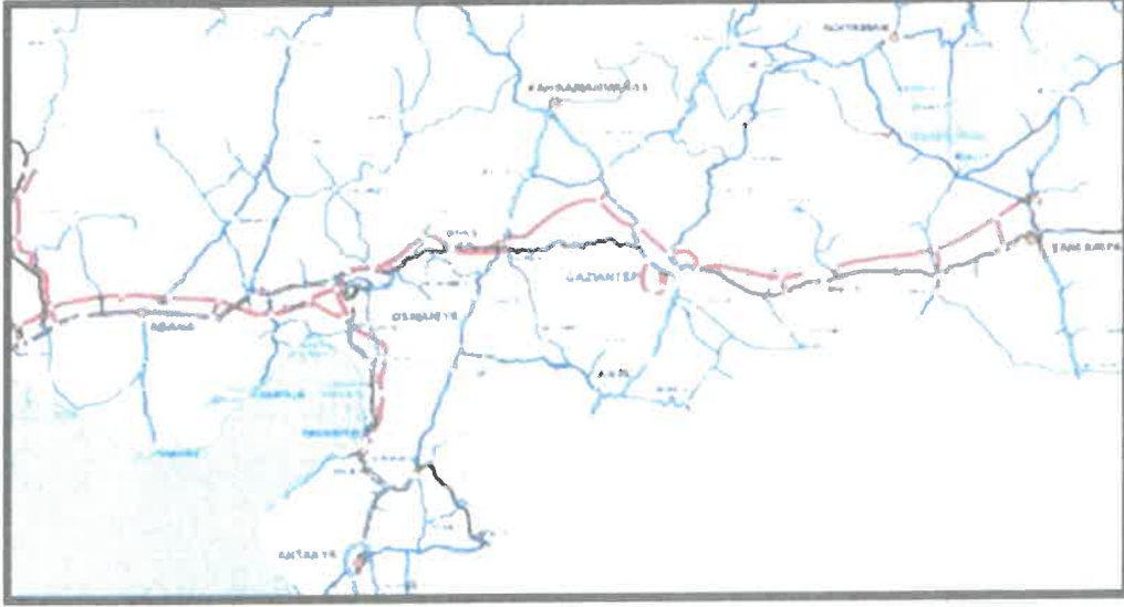
Gaziantep İli Karayolu Bağlantıları

Gaziantep, tarihi İpek Yolu üzerinde olmasından dolayı yüzyıllar boyu önemli bir ulaşım ve ticaret odağı olmuştur. Geçmişten gelen ulaşım odağı olma rolünü günümüzde de sürdürmektedir. Hem demiryolu hem karayolu bağlantılarıyla güneyden Akdeniz'e, batıya ve kuzeye giden yolların kavşak noktasında bulunmaktadır. Kent sınırları içinden geçen E-90 ve D-400 karayolları bölgenin en önemli ulaşım akslarıdır.