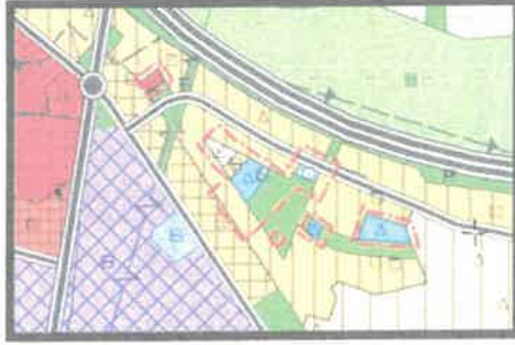
1/25.000 Ölçekli Öneri Nazım İmar Planı

Mahkeme kararı hükümleri uyarınca hazırlanan ilave revizyon nazım imar planı ile bölge halkının donatı ihtiyaçlarının giderilmesi ve etkin donatı alanları oluşturulmak amacıyla değişikliğe konu alanların, otopark, eğitim tesisi alanı, ibadet alanı, kültürel tesis alanı, rekreasyon alanı ve pazar alanı olarak, artan nüfus ihtiyacına bağlı olarak konut ihtiyacının karşılanması ve bölgedeki arazi kullanım kararlarının sürekliliğinin sağlanabilmesi amacıyla plan değişikliğine konu olan alanın bölgedeki yapılaşma kurallarına uygun olarak orta yoğunluklu konut alanı, ticaret+konut alanı olarak planlanması suretiyle 1/25.000 ve 1/5.000 ölçekli nazım imar planı değişikliği hazırlanmıştır.