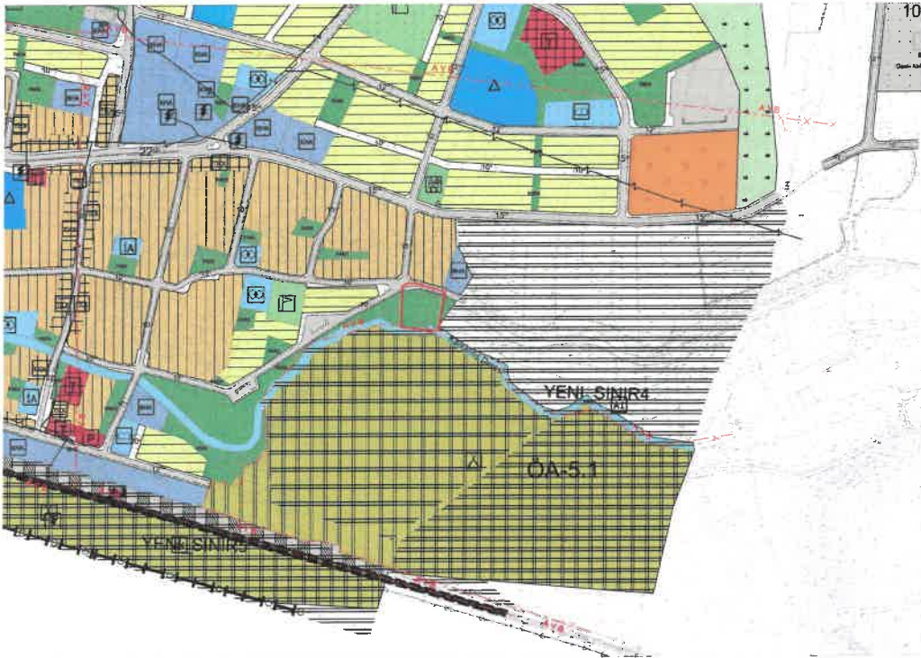
Şekil 2: Planlama Alanı Mevcut 1/5000 Ölçekli Nazım İmar Planı

Planlama alanı yürürlükteki 1/5000 ölçekli nazım imar planında Park ve Yeşil Alan olarak görülmektedir.