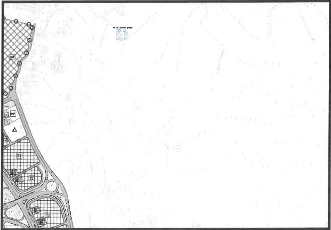
Şekil 3: Planlama Alanı Mevcut 1/5000 Ölçekli Nazım İmar Planı