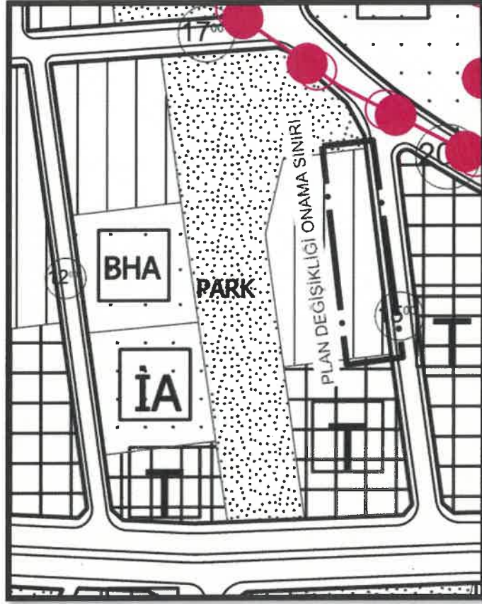
MEVCUT NAZIM İMAR PLANI