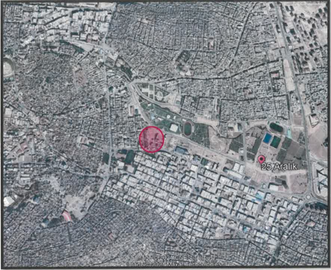
Şekil 2: Çalışma Alanının Konumu