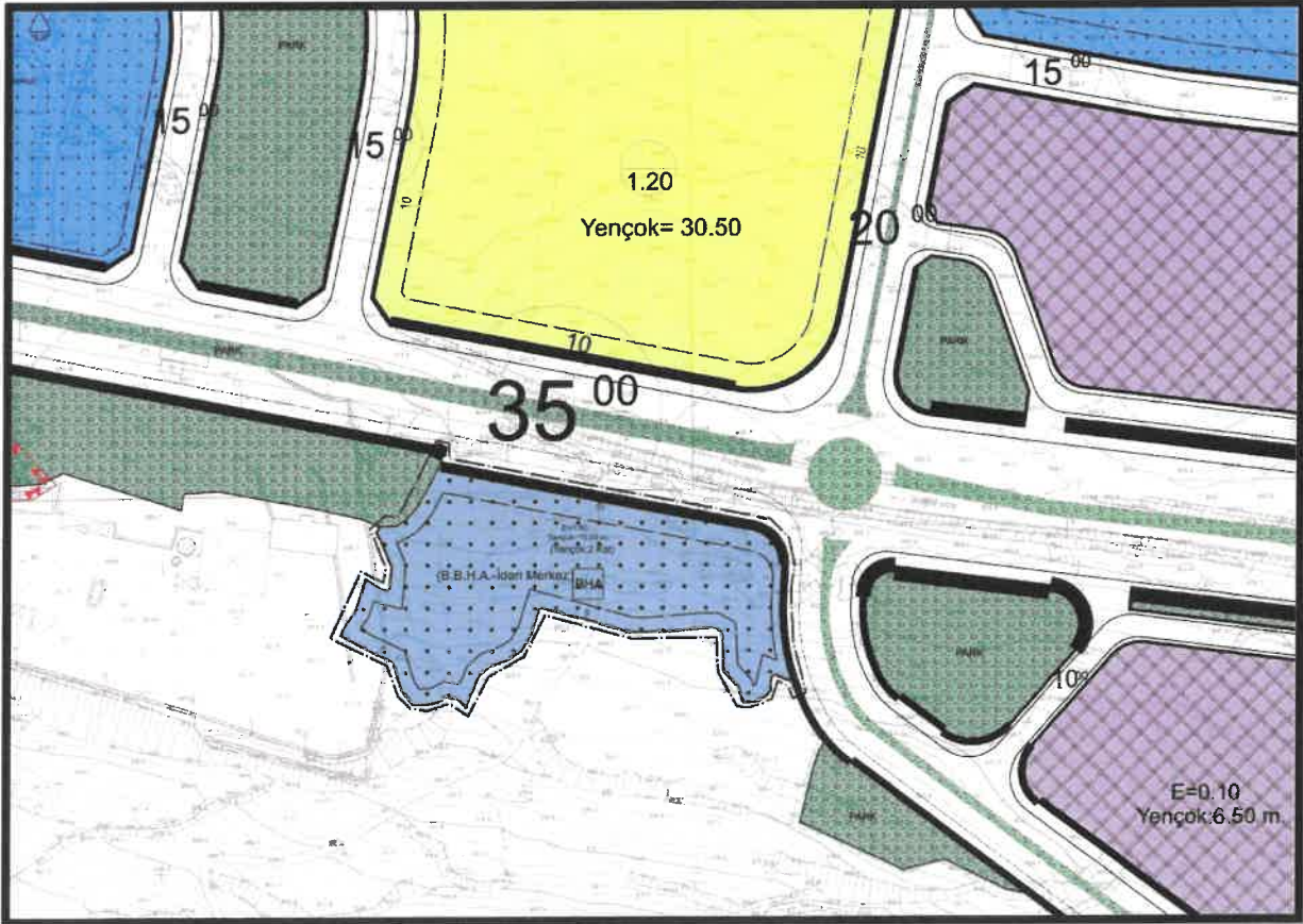
Şekil 3: Planlama Alanı Mevcut 1/1000 Ölçekli Uygulama İmar Planı