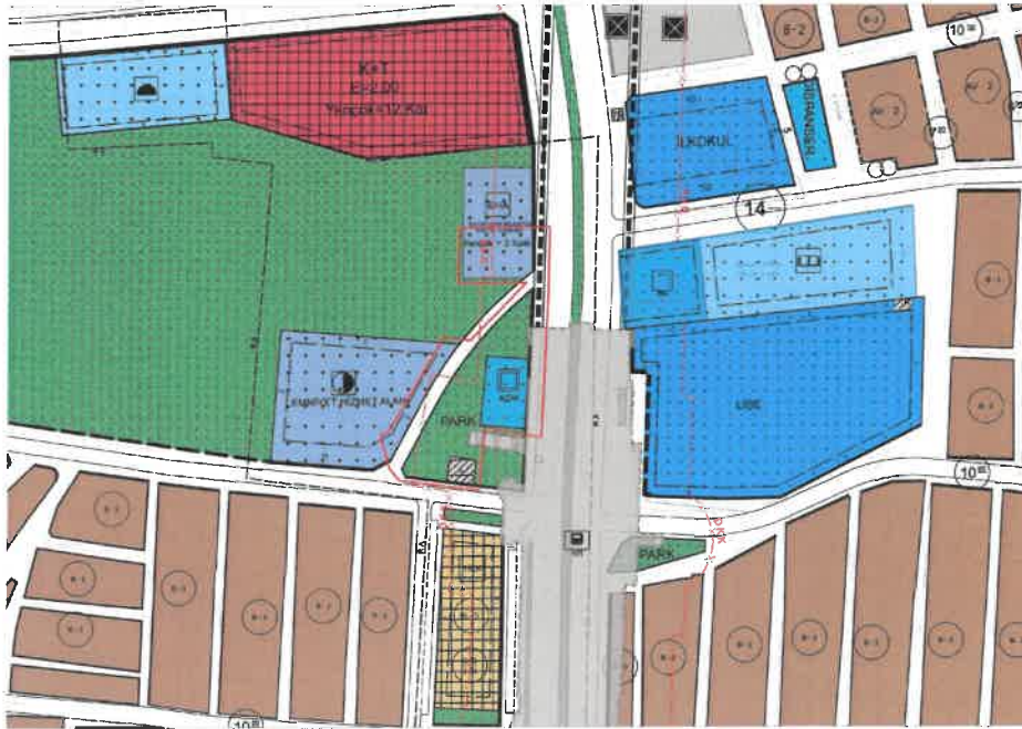
Şekil 2: Planlama Alanı Mevcut 1/1000 Ölçekli Uygulama İmar Planı

Planlama alanı mevcut 1/1000 ölçekli uygulama imar planında BBHA (Sosyal Tesis, Yençok:3 kat), Aile Sağlığı Merkezi, Trafo Alanı, Park ve yaya yolu olarak görülmektedir.