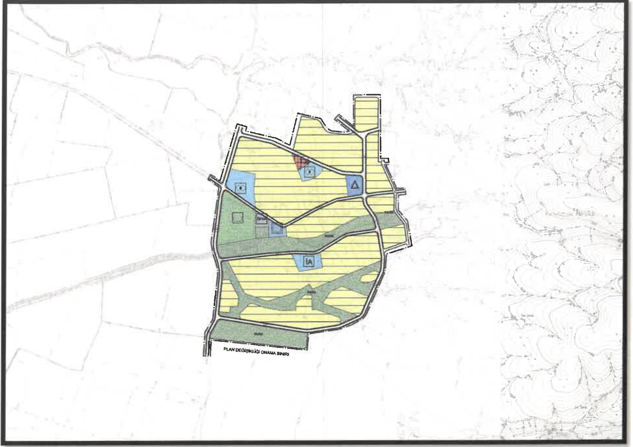
Şekil 2: Planlama Alanı Mevcut 1/5000 Ölçekli Nazım İmar Planı