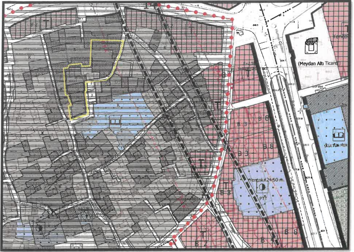
Şekil 2: Planlama Alanı Mevcut 1/1000 Koruma Amaçlı Uygulama İmar Planı