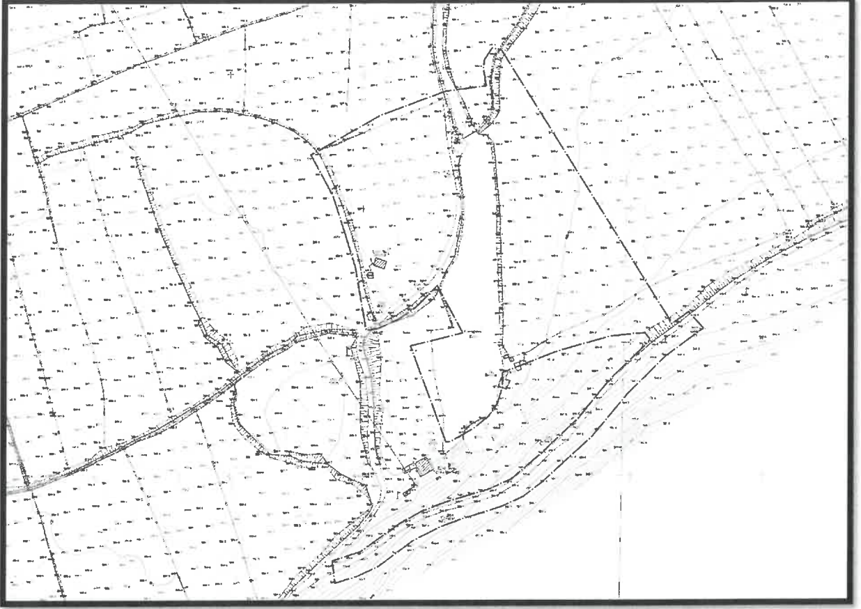
Şekil 2: Planlama Alanı Mevcut 1/1000 Uygulama İmar Planı