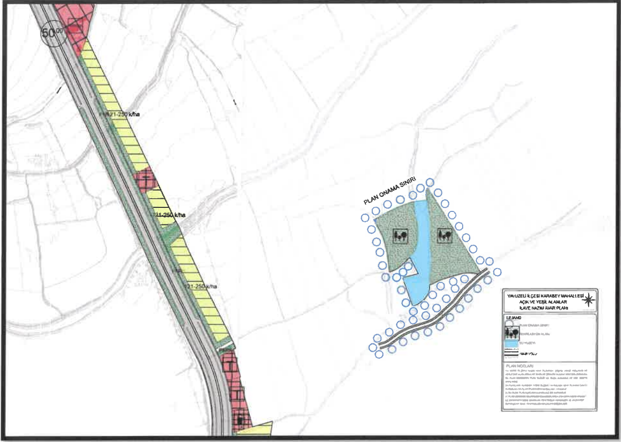
Şekil 3: Planlama Alanı Öneri 1/5000 Nazım İmar Planı