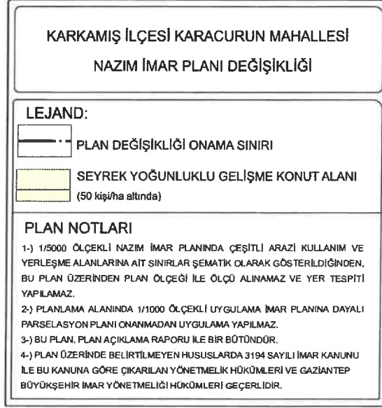
Şekil 3: Öneri 1/5000 Ölçekli Nazım İmar Planı