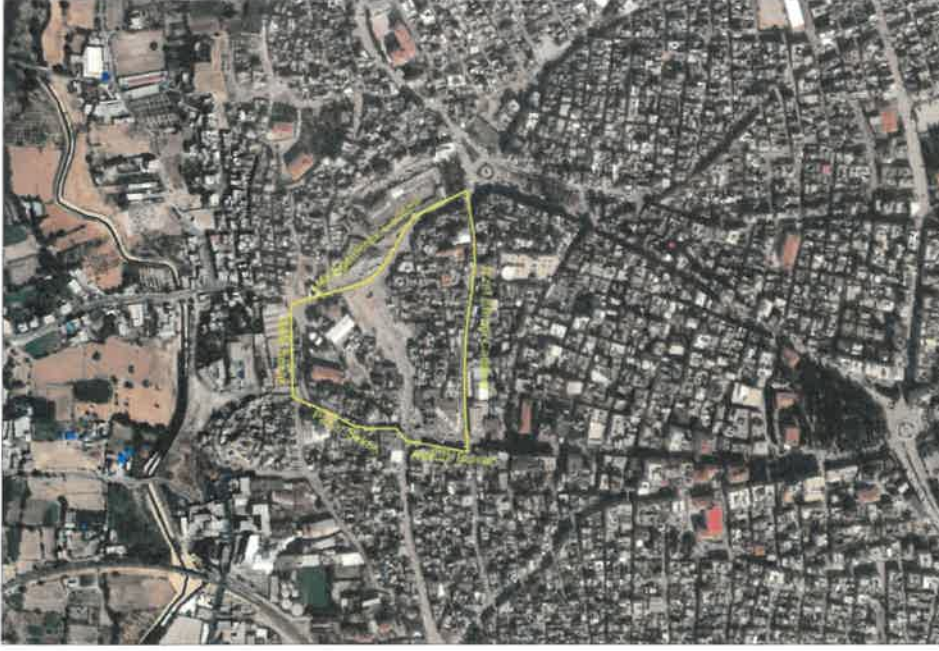
Şekil 1 Planlama Alanı Konumu

Gaziantep ili, Gaziantep İli, Nizip İlçesi, Pazarcami ve Şıhlar Mahalleleri içerisinde yer alan bölge kuzeyde Milli Egemenlik Caddesi, güneyde Pazar Sokak ve Atatürk Bulvarı, batıda Sefa Sokak, doğuda İzzet Efendi Caddesi ile sınırlıdır.