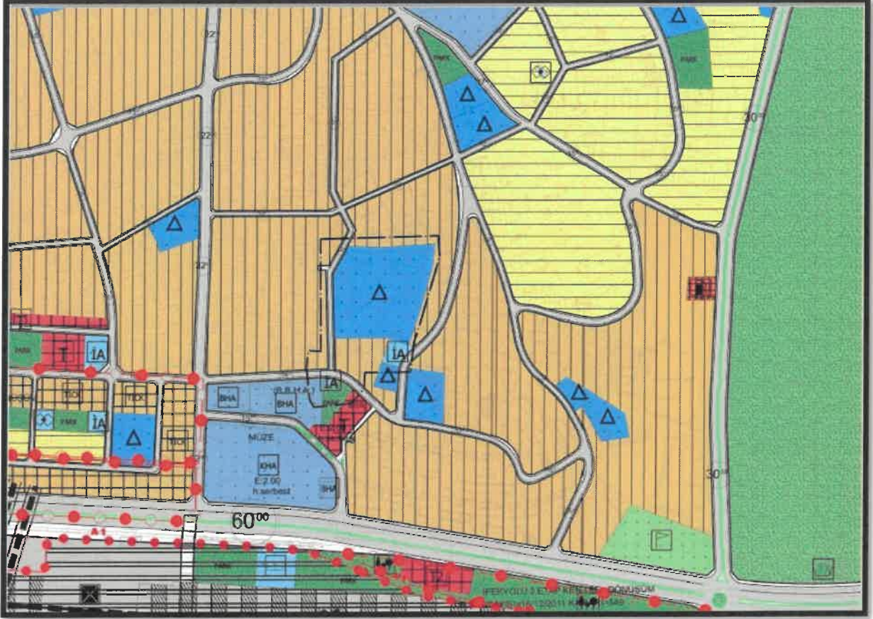
Şekil 3: Planlama Alanı Mevcut 1/5000 Ölçekli Nazım İmar Planı

Planlama alanı Şehitkamil İlçesi, Mithatpaşa Mahallesi, Şekil 1' de gösterilen bölgeyi kapsamakla birlikte söz konusu planlama alanı, yürürlükteki 1/5000 ölçekli nazım imar planında İbadet Alanı, Konut Alanı, Eğitim Alanı, Park, Ticaret ve İmar yolları olarak görülmektedir. Söz konusu alanın yakın çevresinde; ticaret, donatı ve konut kullanımlarının yer aldığı bölgede konumludur.