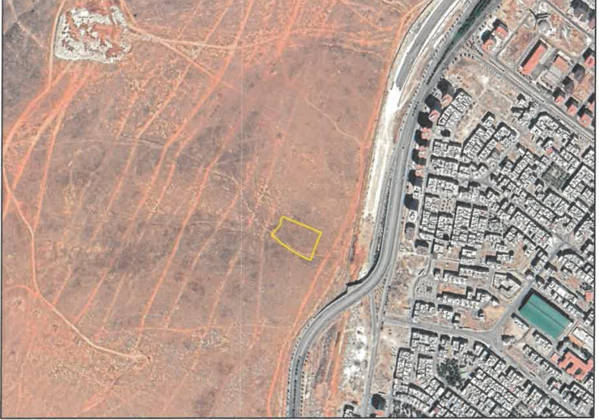
Şekil 1: Planlama Alanının Konumu

Plan deęişikliğine konu alan Şehitkamil İlçesi Özgürlük Mahallesi sınırları içerisinde Turgut Özal Bulvarının batısında ve Bölge Adliye Mahkemesinin kuzeydoğusunda yer almaktadır.