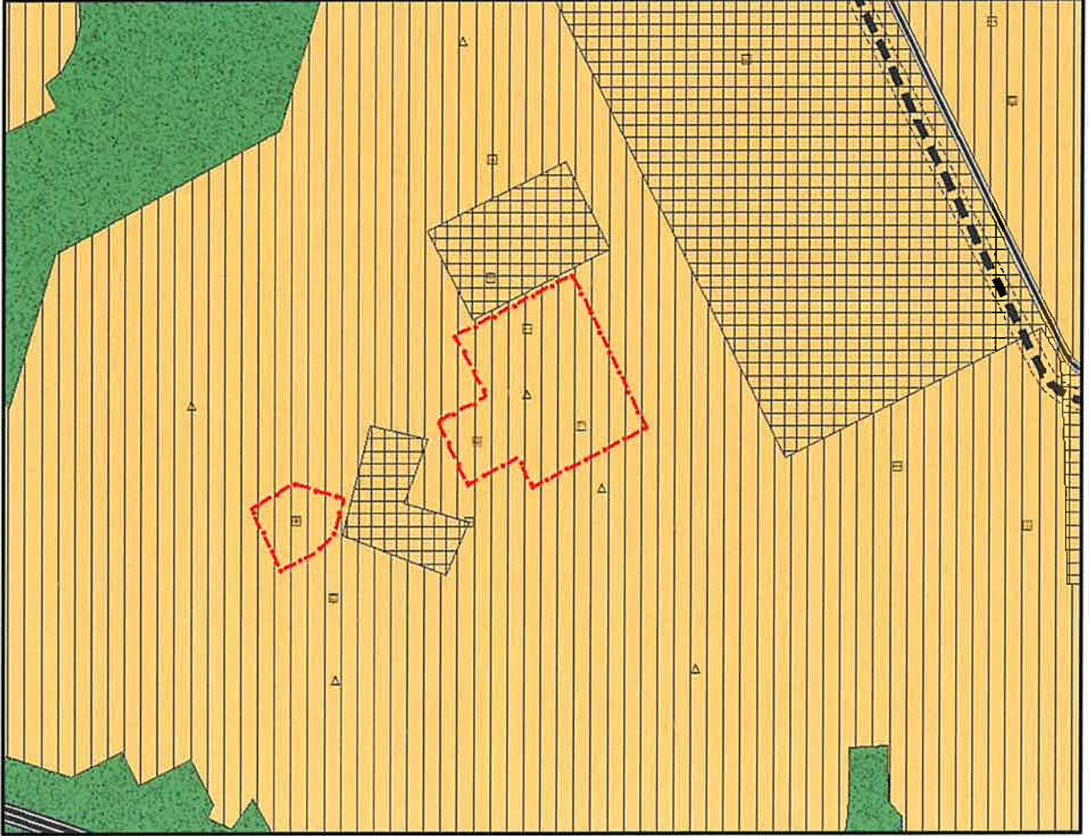
Şekil 5: Şahintepe Mahallesi Proje Alanı Öneri 1/25000 Ölçekli Nazım İmar Planı

Bu kapsamda; 1/25000 ve 1/5000 ölçekli nazım imar planlarında ada 285 parsel 1'de kayıtlı taşınmazı kapsayan alan Sosyal Tesis Alanı, ada 321 parsel 3'te kayıtlı taşınmaz Konut Dışı Kentsel Çalışma Alanı, ada 324 parsel 7'de kayıtlı taşınmaz Eğitim Alanı olarak planlanmıştır. Bununla birlikte söz konusu taşınmazların yakın çevresinde Kültürel Tesis Alanı ve Spor Alanı planlanmıştır.