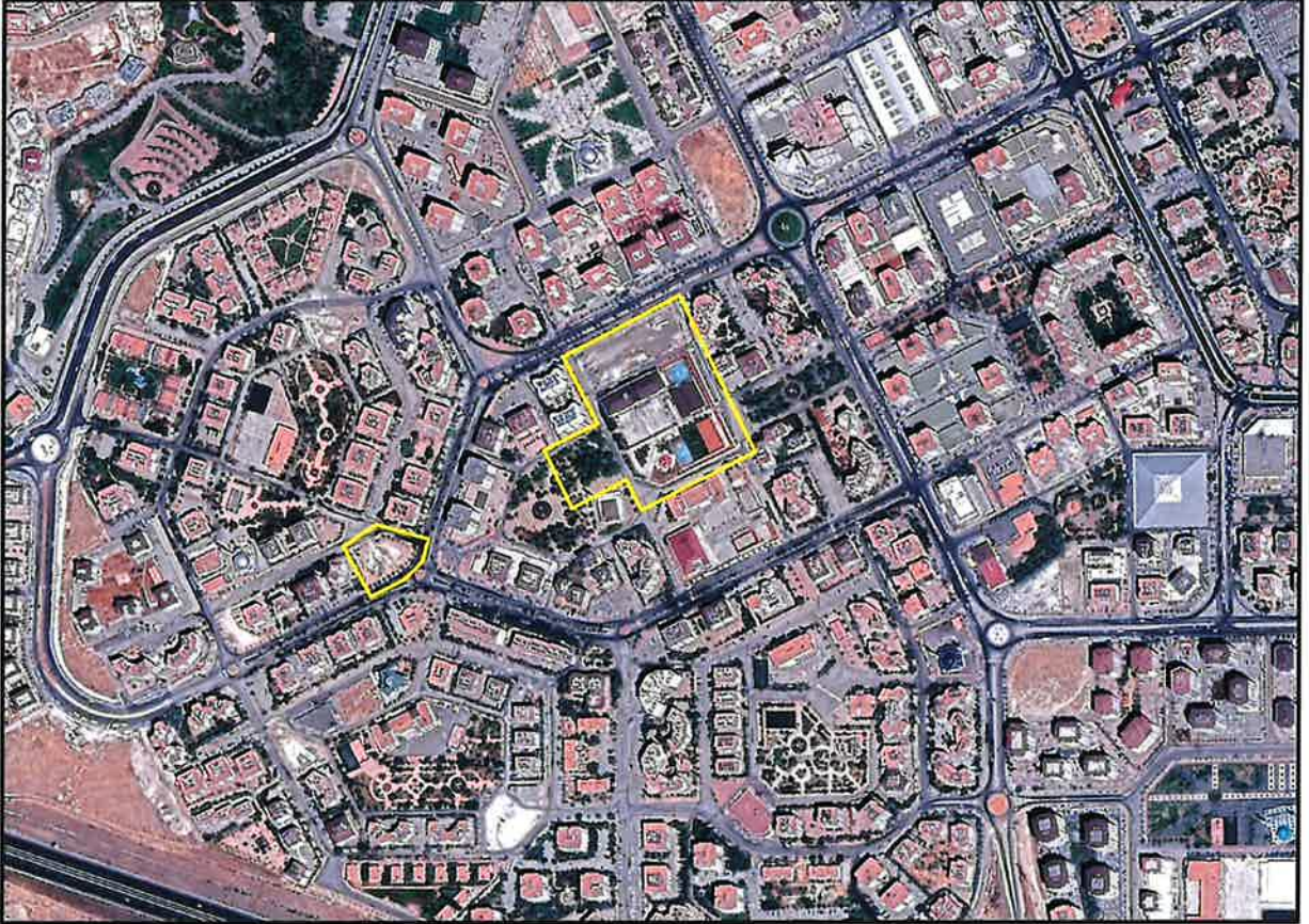
Şekil 1: Proje Alanı Kent İçerisindeki Konumu

1/25000 ve 1/5000 ölçekli nazım imar planı değişikliğine konu ada 285 parsel 1'de kayıtlı taşınmaz ile ada 321 parsel 3 ve ada 324 parsel 7'de kayıtlı taşınmazları kapsayan alanlar Şahinbey İlçesi Şahintepe Mahallesi sınırları içerisinde, 400 numaralı caddenin batısında, 396 numaralı caddenin doğusunda, 133390 ve 133394 numaralı caddeler üzerinde yer almaktadır.