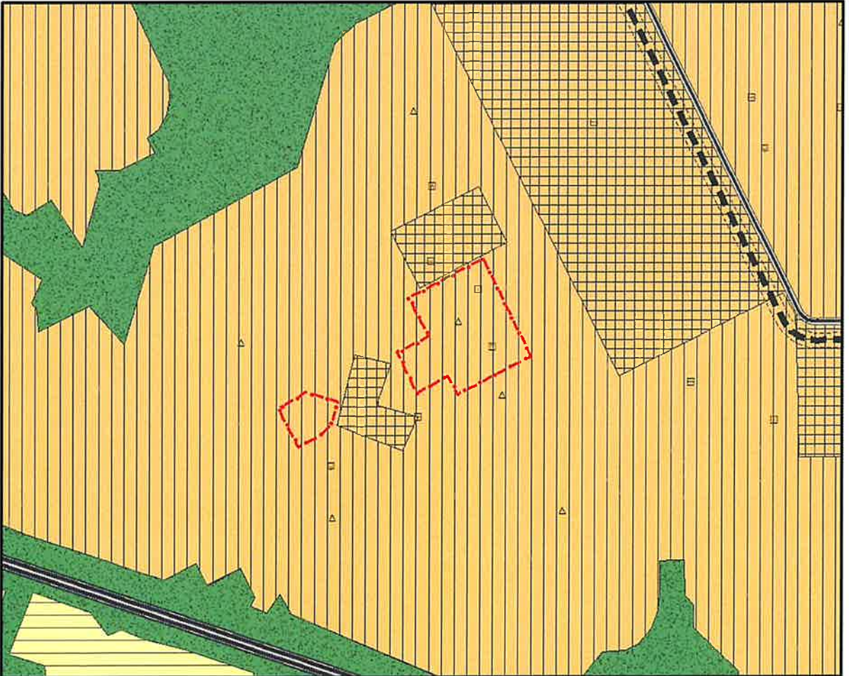
Şekil 3: Şahintepe Mahallesi Proje Alanı Mevcut 1/25000 Ölçekli Nazım İmar Planı