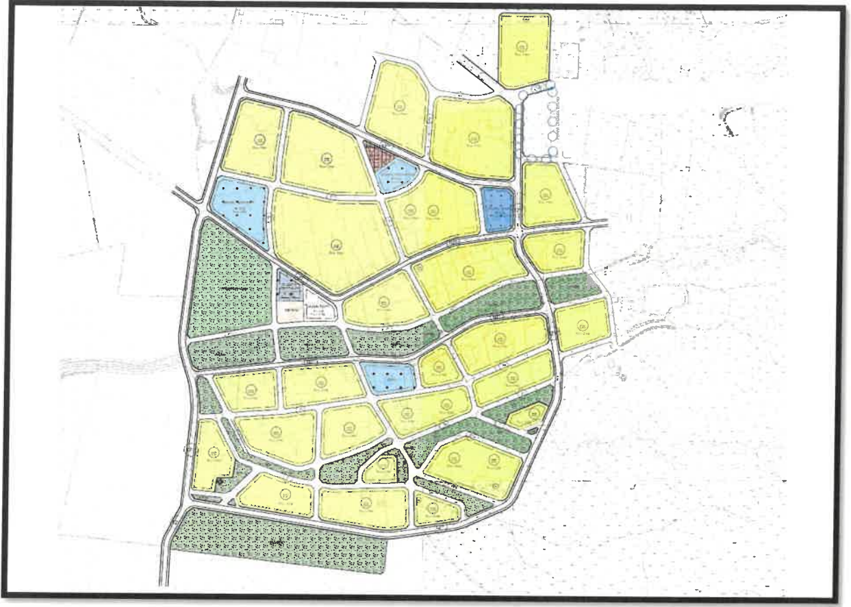
Şekil 2: Planlama Alanı Mevcut 1/1000 Uygulama İmar Plan