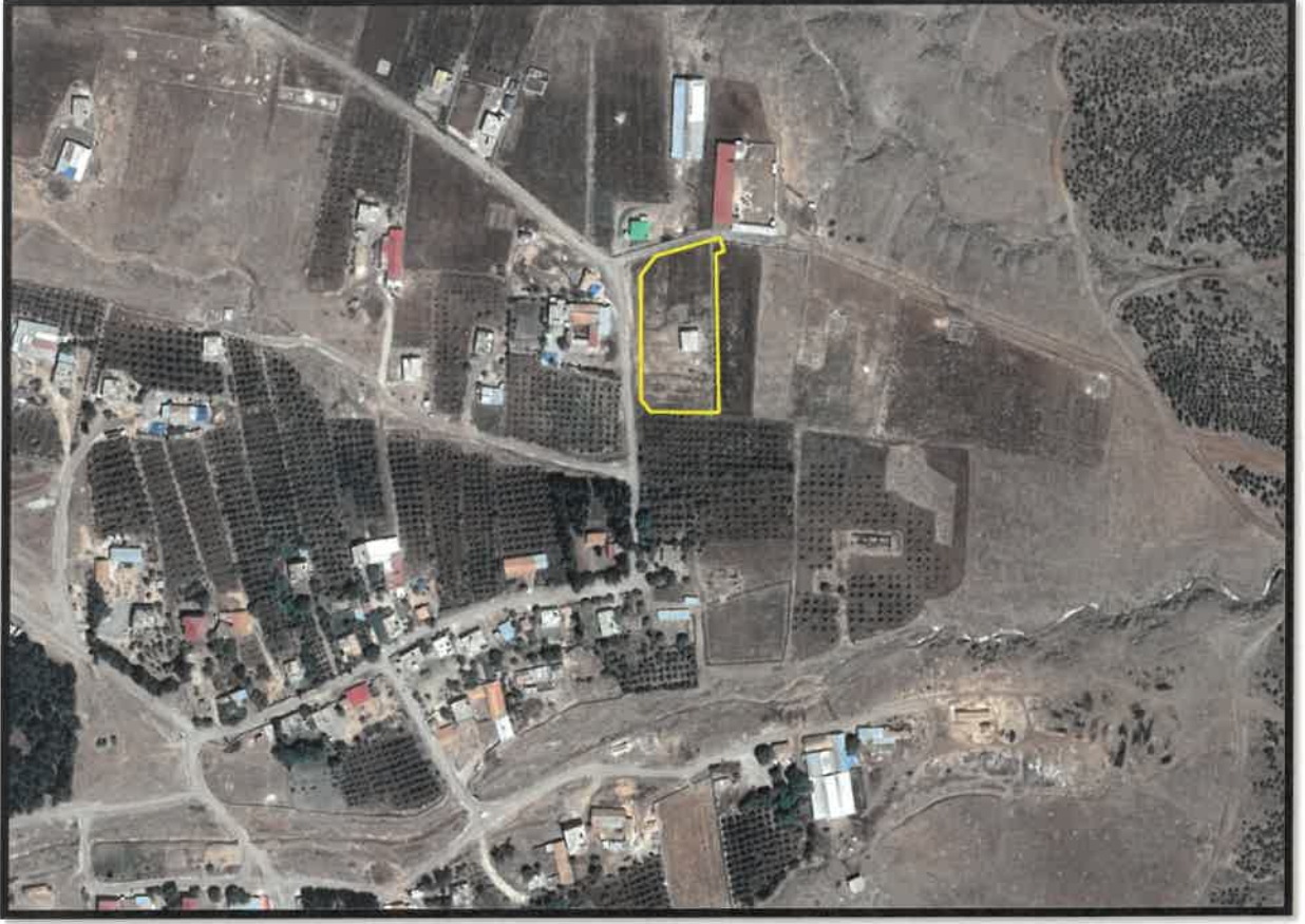
Şekil 1: Planlama Alanı Uydu Görüntüsü

Plan deęişikliğine konu alan, Nurdaęı ilçesi Gözlühöyük mahallesi sınırları içerisinde bulunmaktadır.