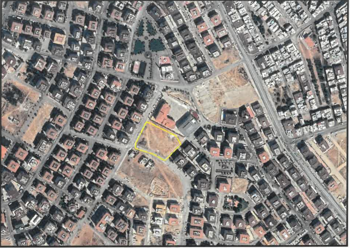
Şekil 1: Şahinbey Güneykent Mahallesi Planlama Alanı Konumu

Planlama alanı Gaziantep ili, Şahinbey İlçesi Güneykent Mahallesi ve Şehitkamil İlçesi 15 Temmuz Mahallesi sınırları içerisinde yer almaktadır.