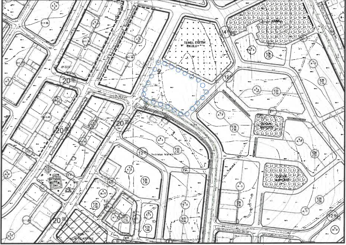
Şekil 3: Şahinbey Güneykent Mahallesi Planlama Alanı Mevcut 1/1000 Uygulama İmar Planı

Şehitkamil İlçesi 15 Temmuz Mahallesi N38c-17c, N38c-17c-1c paftalarında ve Şahinbey İlçesi Güneykent Mahallesi N38c-22b, N38c-22b-4b paftalarında Büyükşehir Belediye Meclisi'nin 14.02.2020 tarih ve 91 sayılı kararı ile onaylanan Büyükşehir Belediye Hizmet Alanı uygulama imar planı değişikliği ile ilgili Gaziantep (3.) İdare Mahkemesinin E:2020/563-K:2021/580 sayılı kararı ile iptal edilmiştir. Söz konusu alanlar park alanı ve plansızdır.