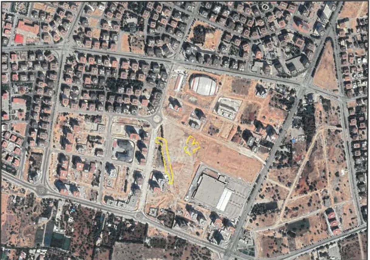
Şekil 2: Şehitkamil 15 Temmuz Mahallesi Planlama Alanı Konumu