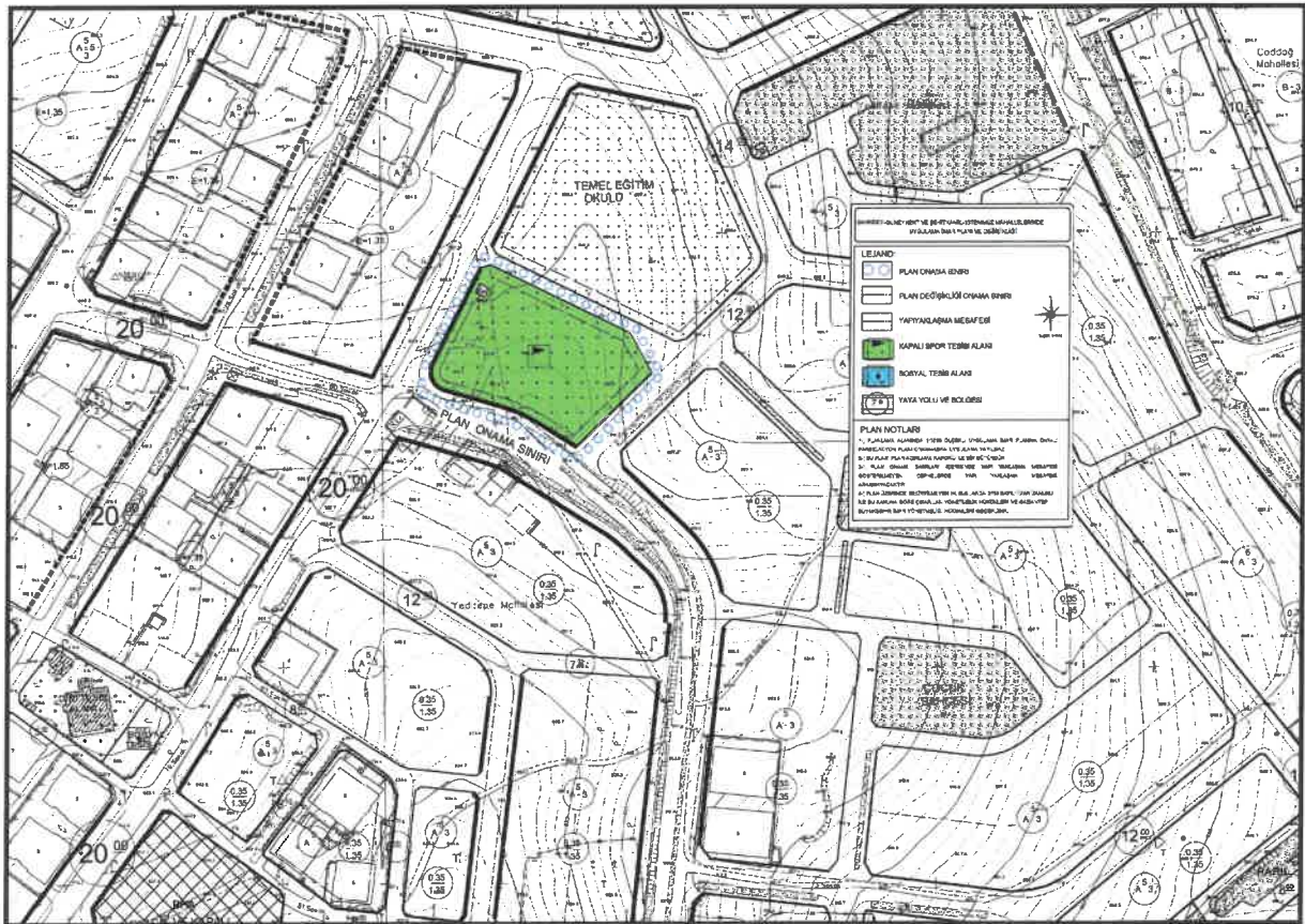
Şekil 5: Şahinbey İlçesi Güneykent Mahallesi Planlama Alanı Öneri 1/1000 Uygulama İmar Planı