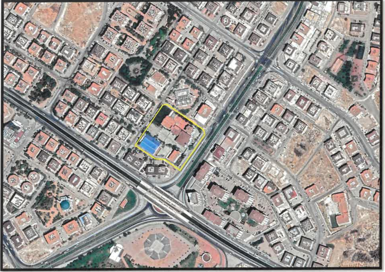
Şekil 1: Planlama Alanı Uydu Görüntüsü

Plan deęişikliğine konu alan, Şahinbey ilçesi Güneykent mahallesi sınırları içerisinde bulunmaktadır.