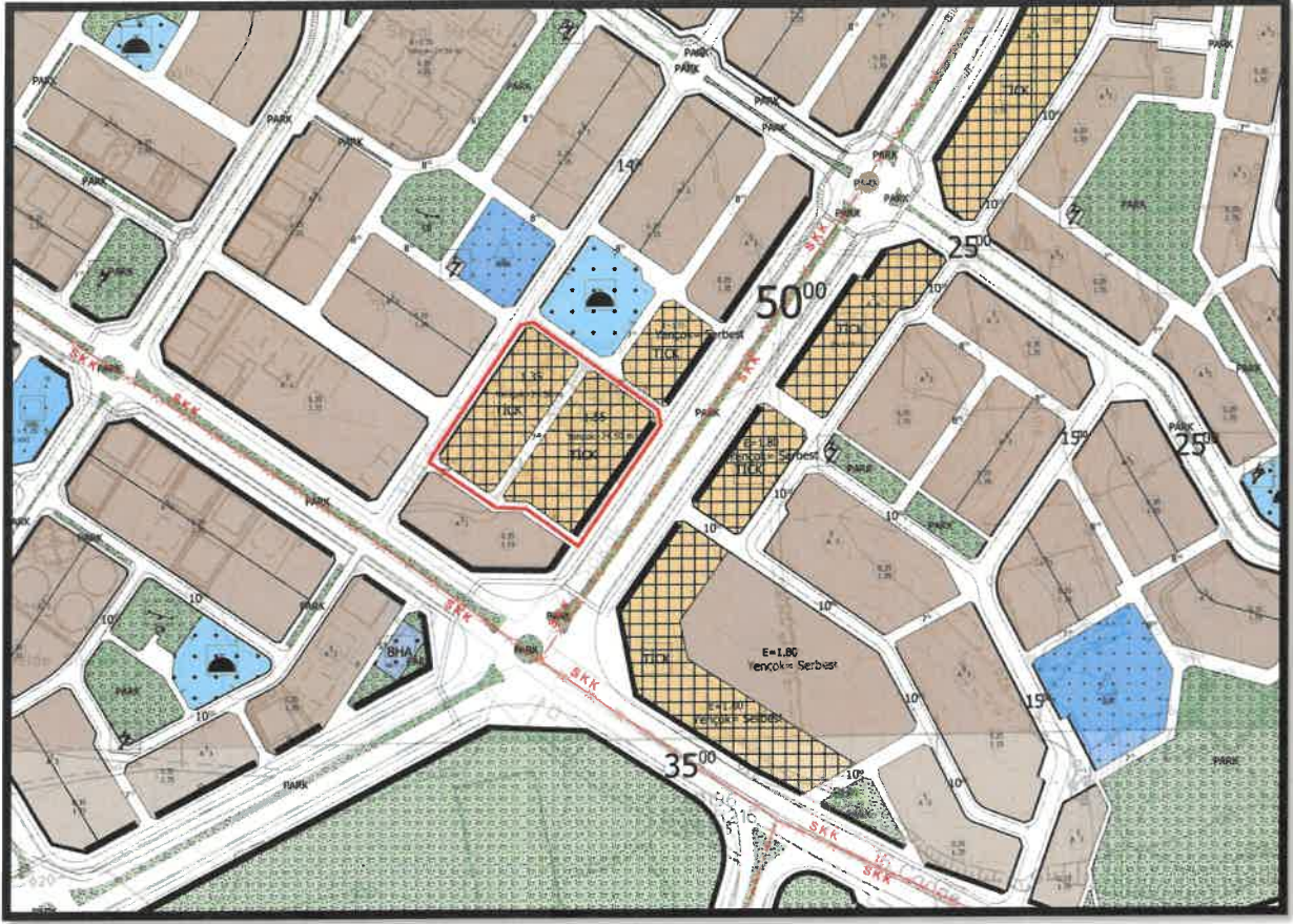
Şekil 2: Planlama Alanı Mevcut 1/1000 Uygulama İmar Plan