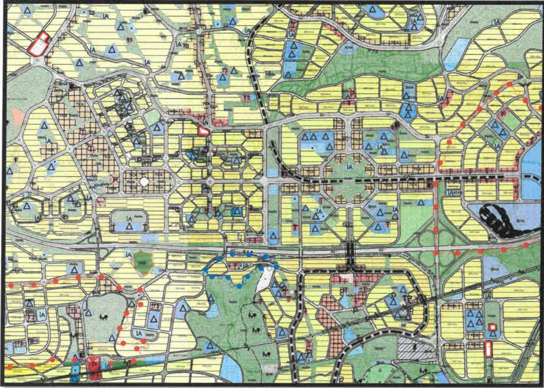
Şekil 3: Planlama Alanı Mevcut 1/5000 Ölçekli Nazım İmar Planı