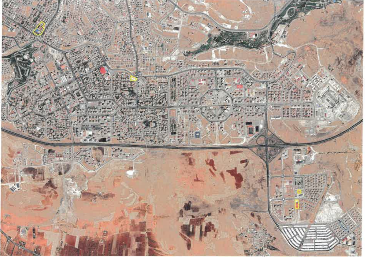
Şekil 1: Planlama Alanı Konumu

İlave+revizyon nazım imar planına konu alan, Şahinbey İlçesi Güneykent, Karataş ve Mavikent Mahalleleri sınırları içerisinde yer almaktadır.