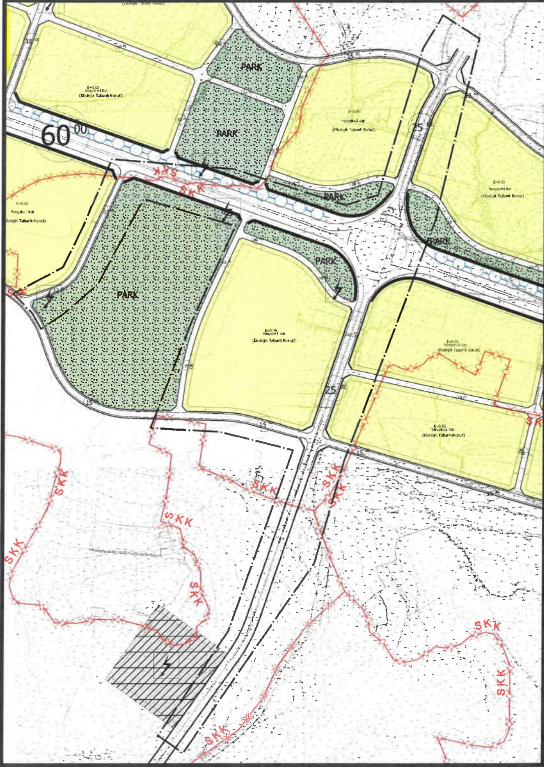
Şekil 2: Planlama Alanı Mevcut 1/1000 Ölçekli Uygulama İmar Planı

Plan değişikliğine konu alan onaylı 1/1000 ölçekli Uygulama İmar Planında " Gelişme Konut Alanı, Park Alanı, Trafo Alanı ve İmar Yolu " olarak görülmektedir.