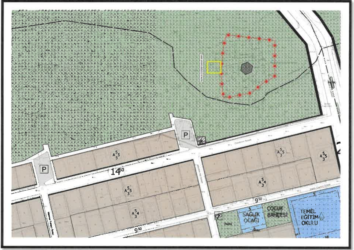
Şekil 2: Planlama Alanı Mevcut 1/1000 Uygulama İmar Planı