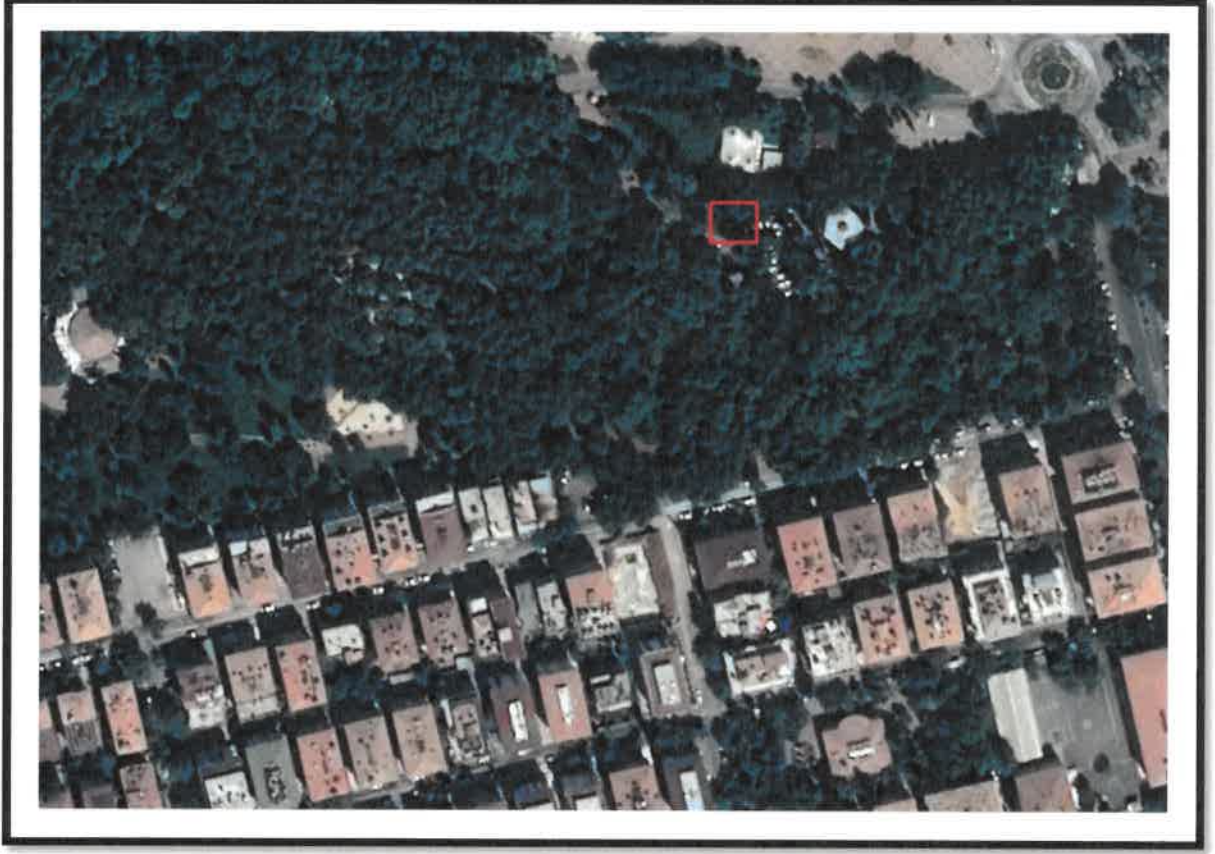
Şekil 1: Planlama Alanı Konumu

Plan deęişikliğine konu alan Şehitkamil İlçesi Gazi Mahallesi 100. Yıl Atatürk Kültür Parkı Alanı sınırları içerisinde kalmaktadır.