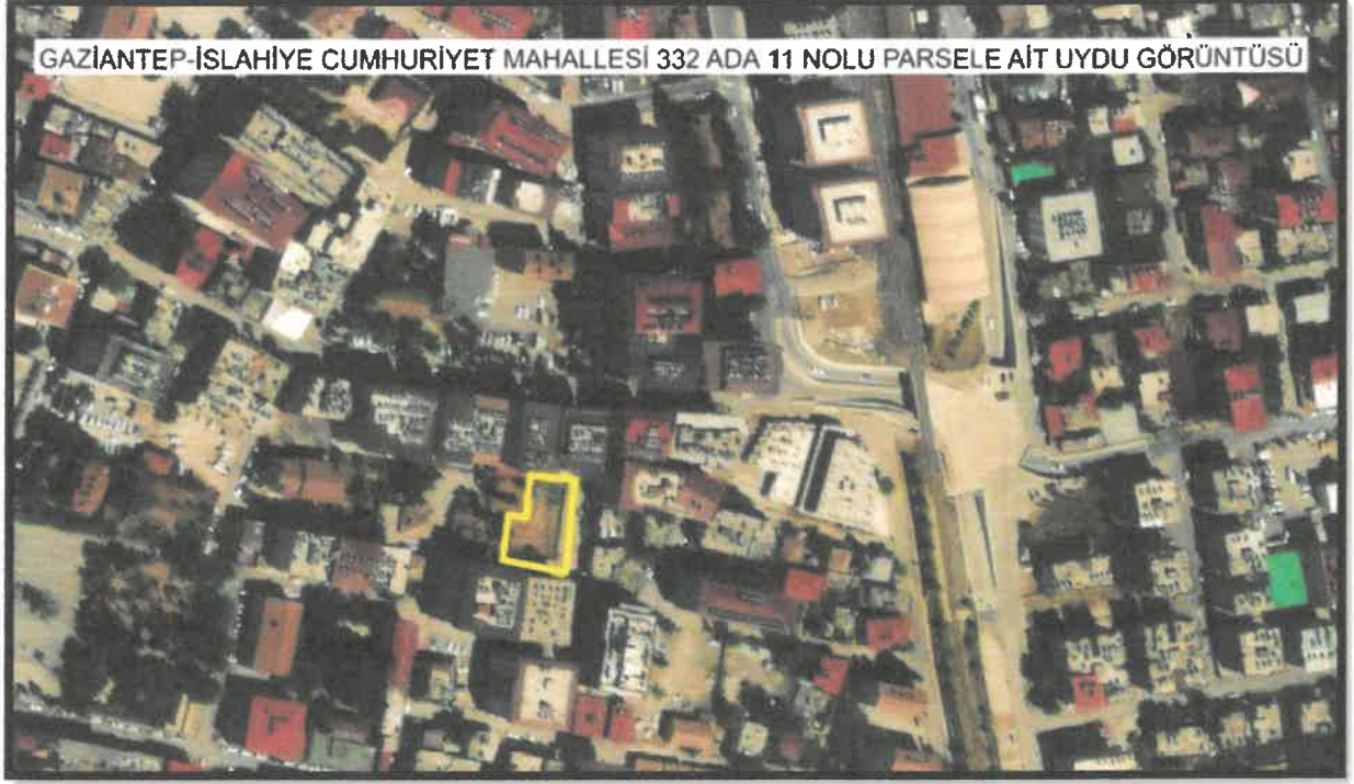
Şekil 1: Planlama Alanına Ait Uydu Görüntüsü

Planlama alanına ait uydu görüntüsü aşağıda gösterilmiştir.