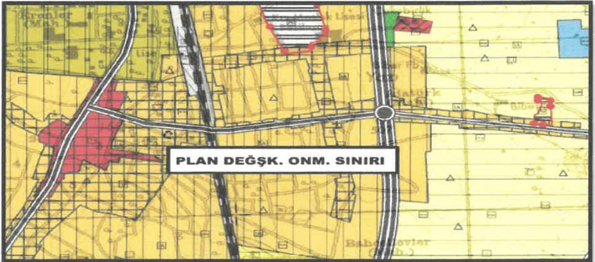
Şekil 2: Planlama Alanına Ait 1/25000 ölçekli Mevcut Nazım İmar Planı(N37-D3 İMAR PAFTASI)

Planlama alanı 1/25000 ölçekli Nazım İmar planında Konut+Ticaret alanı olarak planlıdır.