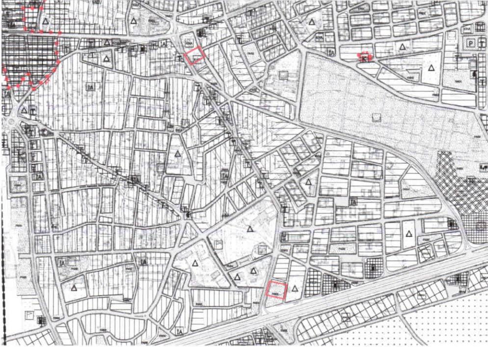
Şekil 2: Planlama Alanı Mevcut 1/5000 Nazım İmar Planı

Planlama alanı 1/5000 ölçekli nazım imar planında Kamu Hizmet Alanı ve Park Alanı olarak görülmektedir.