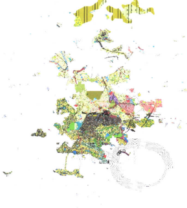
Şekil 2: Öneri 1/1000 Ölçekli Uygulama İmar Planı Değişikliği