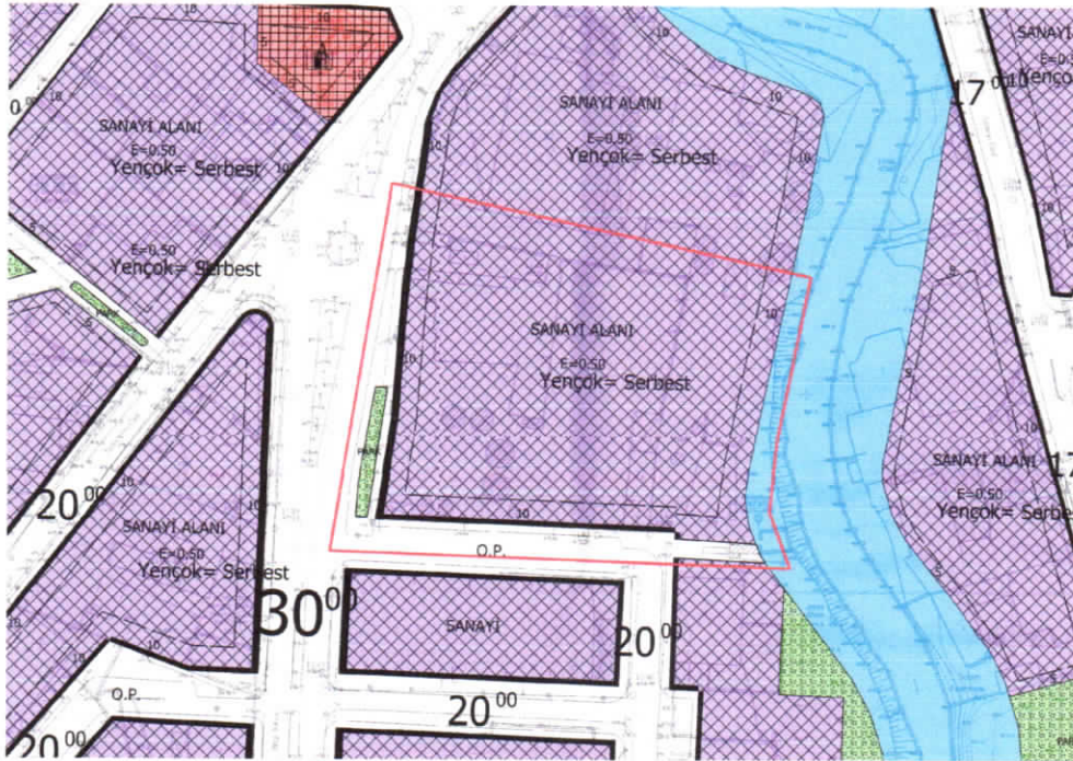
Şekil 2: Planlama Alanı Mevcut 1/1000 Uygulama İmar Planı

Planlama alanı mevcut 1/1000 ölçekli uygulama imar planında Sanayi Alanı (E:0.50, Yencok:serbest) ve park alanı olarak görülmektedir.