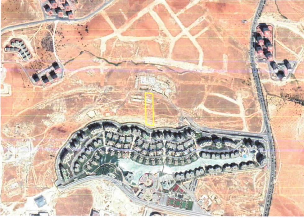
Şekil 1: Planlama Alanı Konumu

Gaziantep ili, Şahinbey İlçesi Beştepe Mahallesi sınırları içerisinde bulunan planlama alanı, Gaziantep İslam Bilim ve Teknoloji Üniversitesi' nin kuzeyinde yer almaktadır.