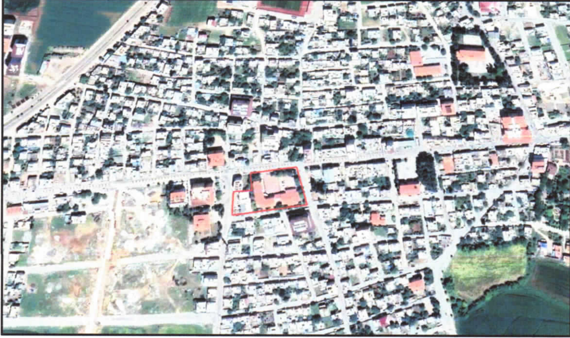
Şekil 1: Kent İçerisindeki Konum

Bahse konu alan Gaziantep Caddesinin Güneyinde, Gürsel Caddesinin Kuzeyinde, Tuzcular Caddesinin batısında ve Cezaevi Caddesinin Doğusunda yer almaktadır.