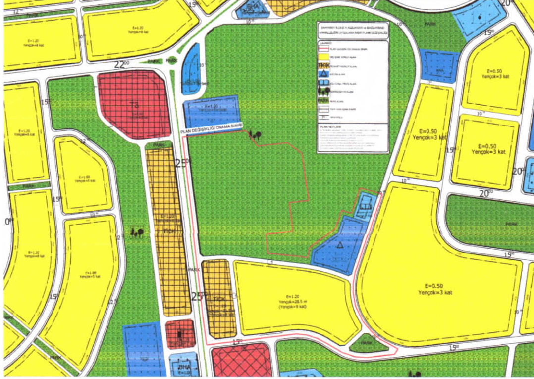
Şekil 3: Planlama Alanı Öneri 1/1000 Uygulama İmar Planı

Büyükşehir Belediyesi Kilis Yolu Kentsel Dönüşüm ve Gelişim Proje Alanı sınırları içerisinde yer alan söz konusu bölgede topoğrafya ve fiziki dokudan kaynaklanan uygulama sorunlarının önüne geçilmesi amacıyla yapılaşma koşulları değiştirilmeden ticaret+konut alanı (E:1.20, Yençok:8 kat), konut alanı (E:1.20, Yençok:8 kat), eğitim alanı (E:1.00, Yençok:3 kat), kültürel tesis alanı (E:1.00, Yençok:3 kat), rekreasyon alanı ve imar yolu şeklinde 1/1000 ölçekli uygulama imar planı değişikliği hazırlanmıştır.