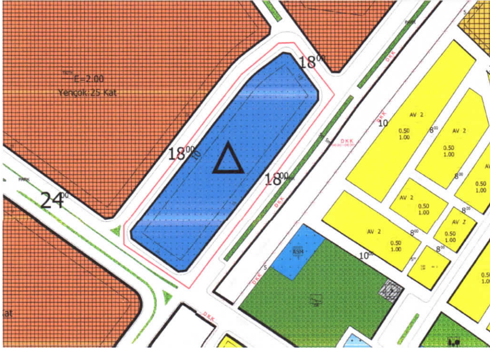
Şekil 2: Planlama Alanı Mevcut 1/1000 Uygulama İmar Planı

Planlama alanı 1/1000 ölçekli uygulama imar planında, eğitim alanı olarak görülmektedir.