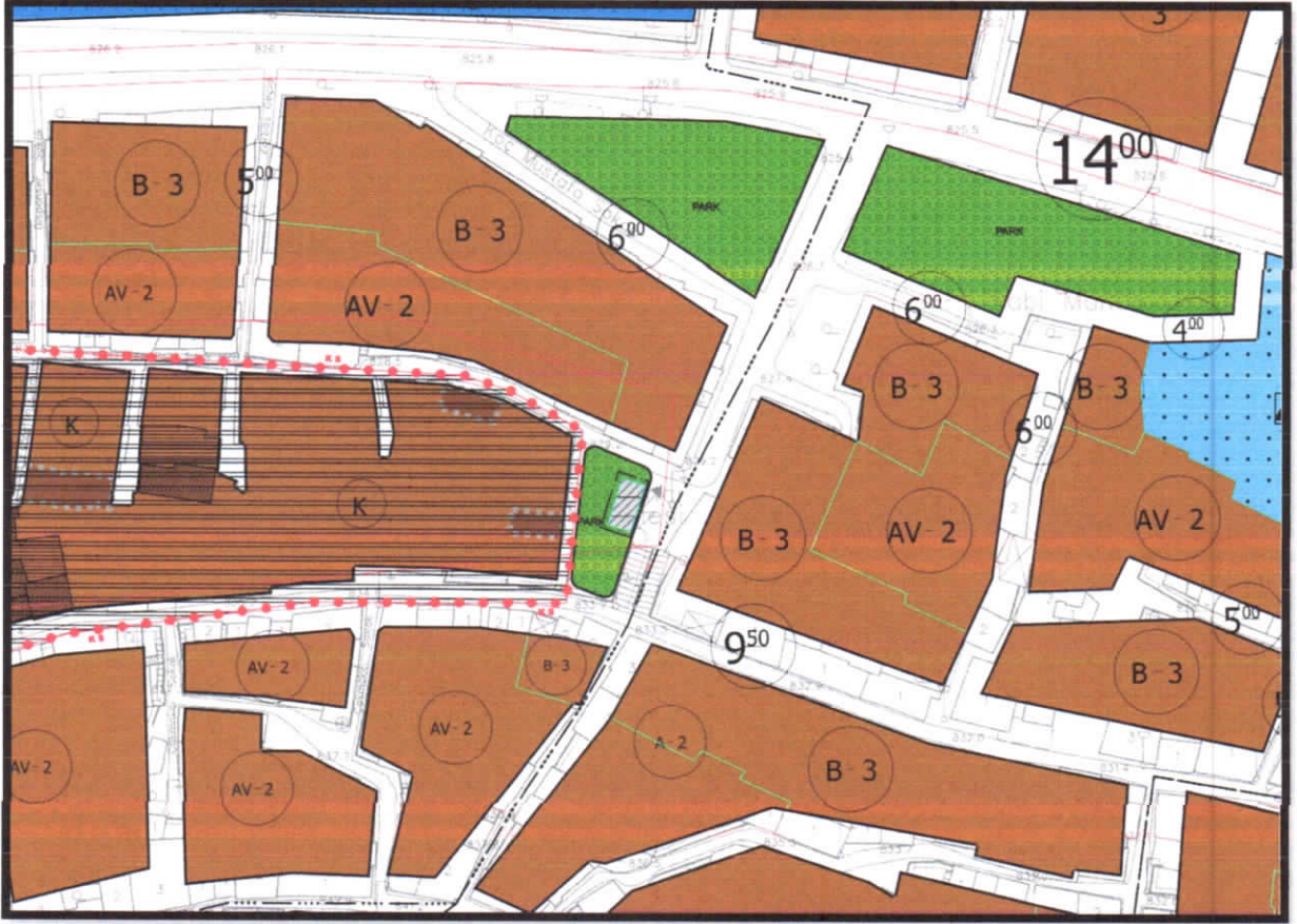
Şekil 12: Bostancı Mahallesi Planlama Alanı Öneri 1/1000 Koruma Amaçlı Uygulama İmar Planı