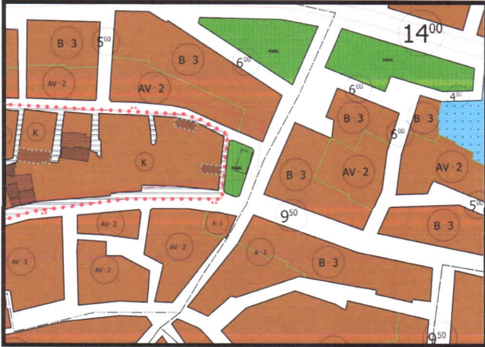
Şekil 2: Bostancı Mahallesi Planlama Alanı Mevcut 1/1000 Koruma Amaçlı Uygulama İmar Planı

Şahinbey Bostancı Mahallesi sınırları içerisinde bulunan plan deęişikliğine konu alan mevcut koruma amaçlı uygulama imar planında Park Alanı olarak görülmektedir.