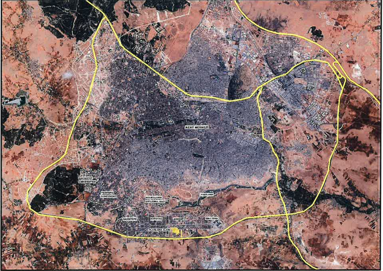
Şekil 1: Proje Alanı Kent İçerisindeki Konumu