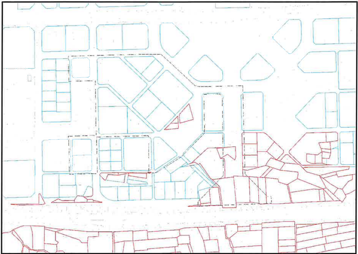
Şekil 3: Proje Alanı Kadastro ve Hâlihazır Durumu Haritası