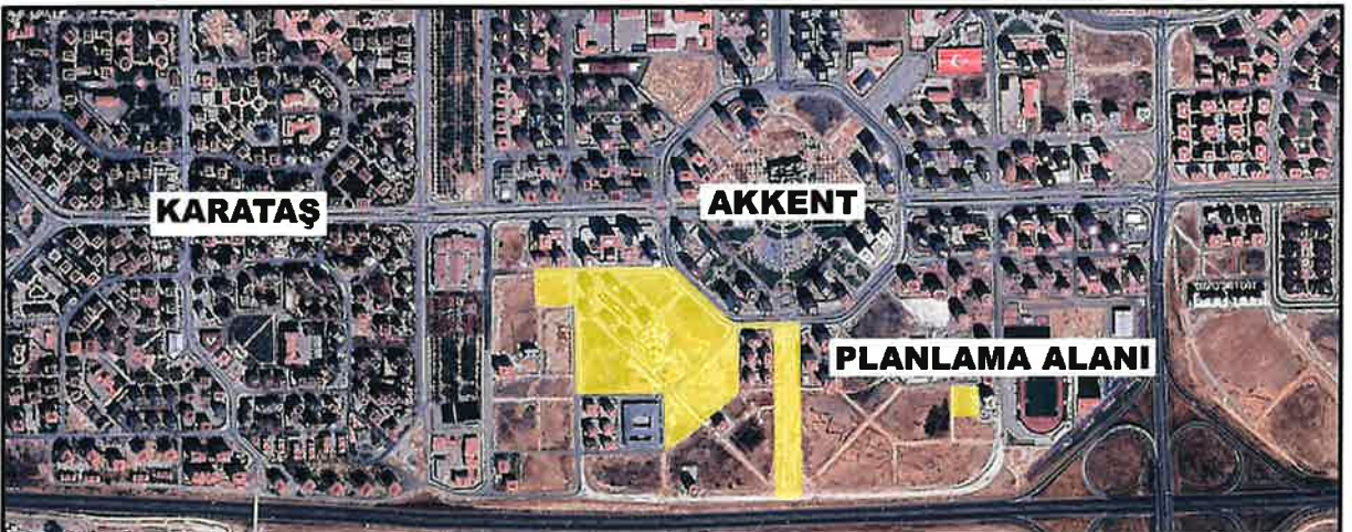
Şekil 2: Planlama Alanı