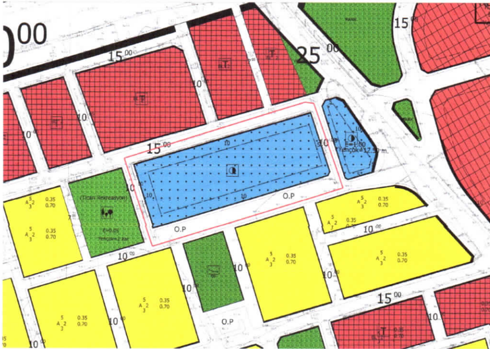
Şekil 2: Planlama Alanı Mevcut 1/1000 Uygulama İmar Planı

Planlama alanı 1/1000 ölçekli uygulama imar planında, resmi kurum alanı olarak görülmektedir.