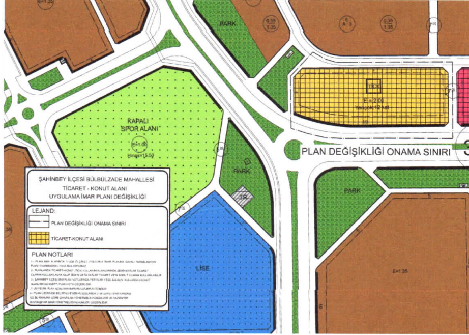
Şekil 3: Öneri 1/1000 Ölçekli Uygulama İmar Planı

Bahse konu alanda imar planında ve kentsel fiziki mekanda bütünlük ve süreklilik sağlamak, yapılaşma ve kullanımlarda dil birliği ve uyumlu bir silüet yakalamak amacıyla ticaret+konut (E:2.00 Y ençok:12 Kat) alanı şeklinde 1/1000 ölçekli uygulama imar planı değişikliği hazırlanmıştır.