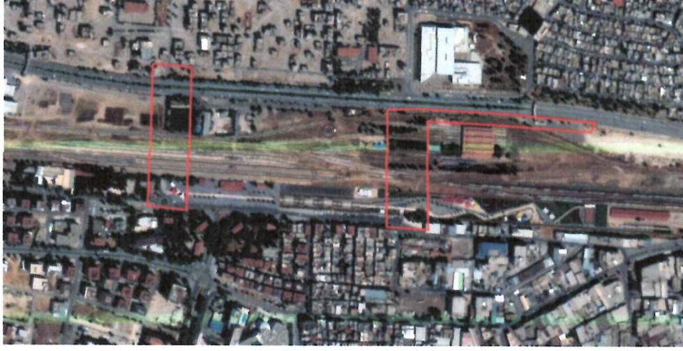
Şekil 1: Uydu Görüntüsü

Şehitkamil ilçesi Mücahitler, Yaprak ve Çakmak mahallerinde bulunan planlama alanı Sanikonukoğlu Bulvarının güneyinde, Zafer Caddesi' nin kuzeyinde yer almakta olup ve Gaziantep istasyon alanı ve yakın çevresidir.