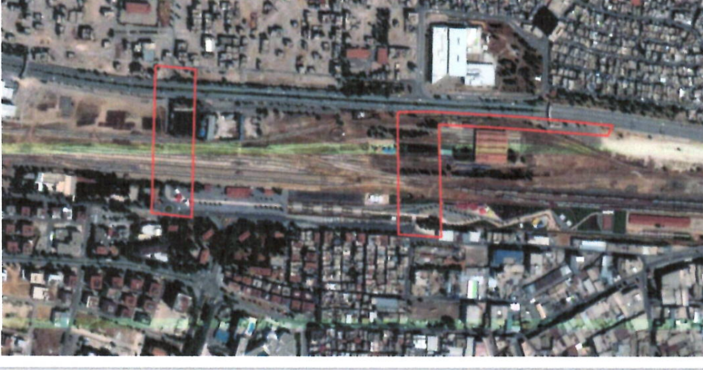
Şekil 1: Uydu Görüntüsü

Şehitkamil ilçesi Mücahitler, Yaprak ve Çakmak mahallerinde bulunan planlama alanı Sanikonukoğlu Bulvarının güneyinde , Zafer Caddesi' nin kuzeyinde yer almakta olup ve Gaziantep istasyon alanı ve yakın çevresidir.